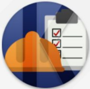
공사 및 시설물

코러스(KORUS, KOREAN university Resource United System)는 상호 조화와 협력을 상징하는 것으로 국립대학의 인적 물적 자원을 통합한 행 재정자원관리 시스템입니다.