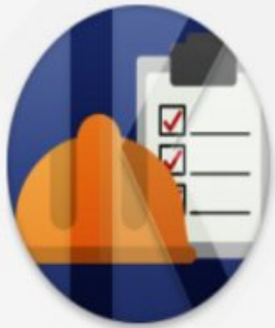
공사 및 시설물

코러스(KORUS, KOrean university Resource United System)는 상호 조화와 협력을 상징하는 것으로 국립대학의 인적·물적 자원을 통합한 행 재정자원관리 시스템입니다.